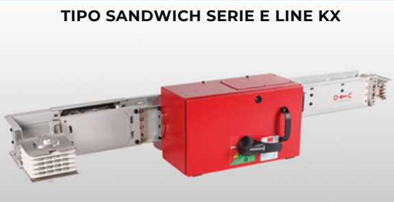
TIPO SANDWICH SERIE E LINE KX